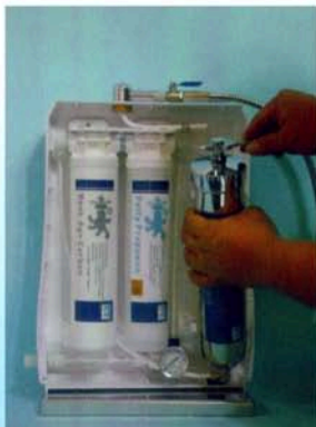
拆除陶瓷鋼瓶水管