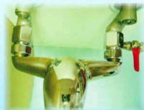
六分進水三通+二分考克