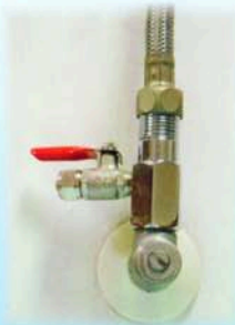
流理台下安裝法 四分進水三通+二分考克