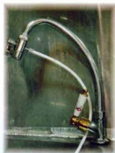
切換器+吧檯式龍頭